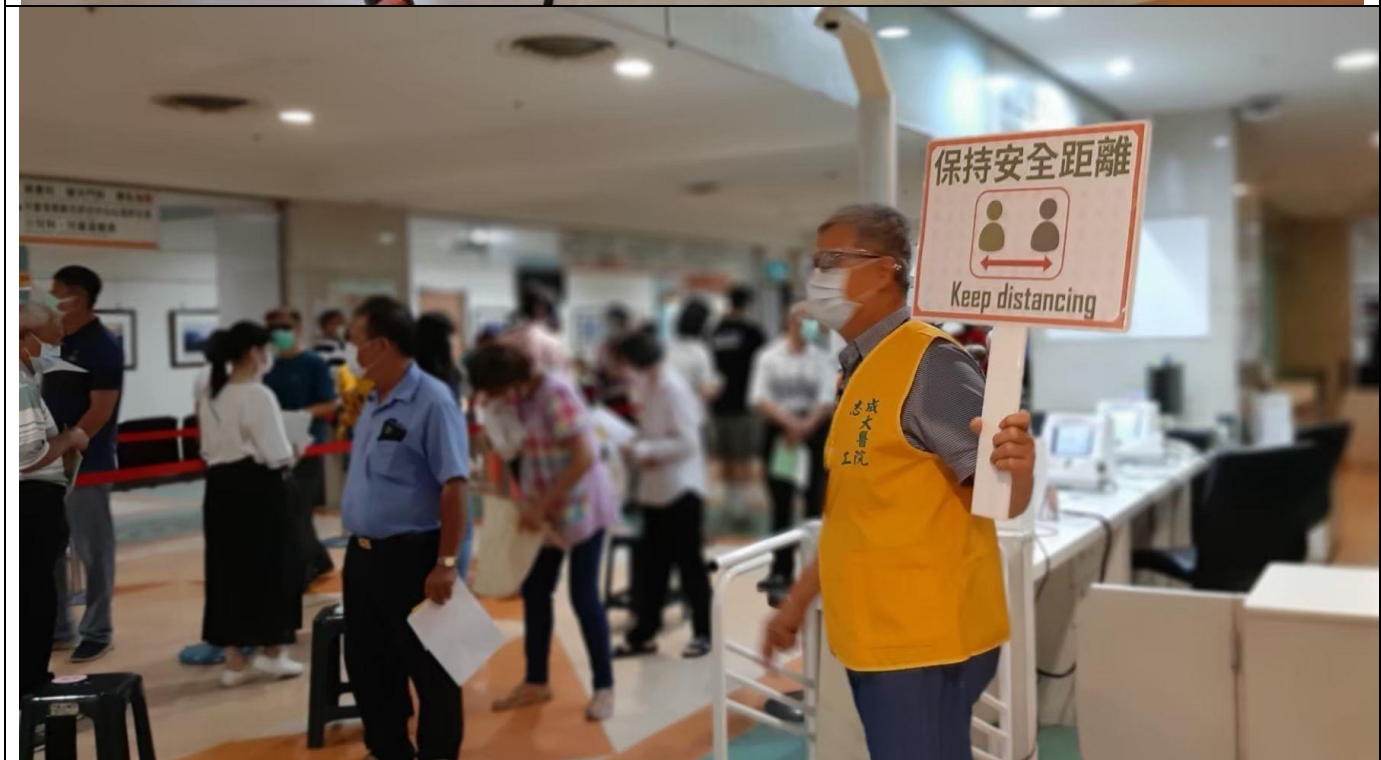
疫苗接種期間，周六周日額外出勤 提醒民眾保持距離，避免過度擁擠