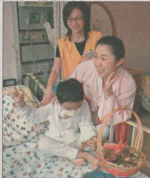
↑穿著傳統韓服的韓國美女分送月餅，小病童很歡喜。

秋節放假1天，韓國則是3天連假，相當重視中秋節這個節日；而韓國人中秋節不吃月餅，而是一種年糕，對於要在醫院裡分送月餅給病人，覺得蠻有趣的。