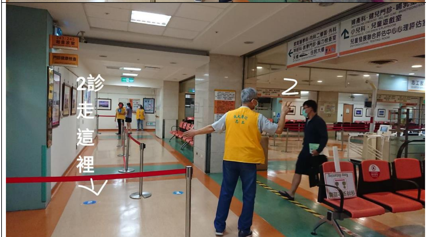
疫苗接種期間，周六周日額外出勤 主要在 2 樓醫師問診區作分流工作