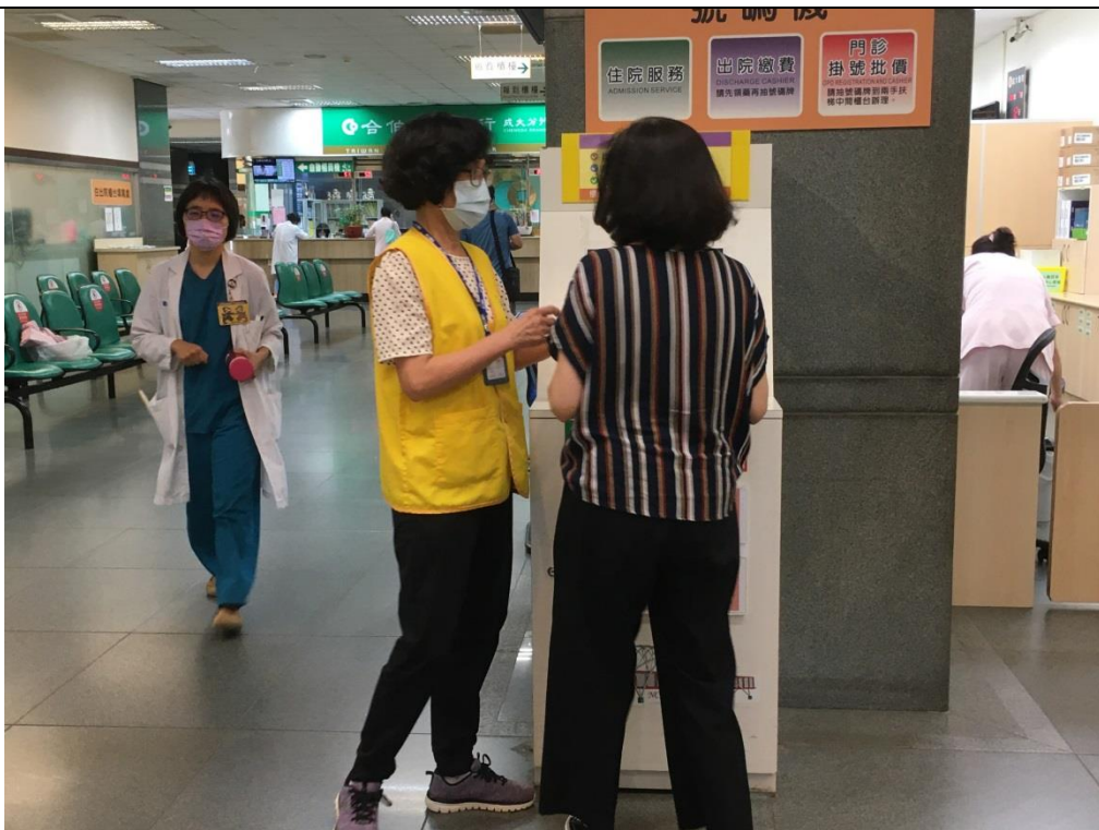
協助民眾就醫流程諮詢