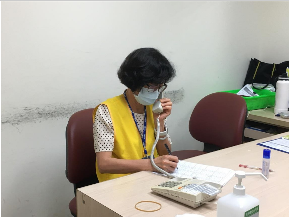
協助社工部執行受助案家的滿意度電訪工作